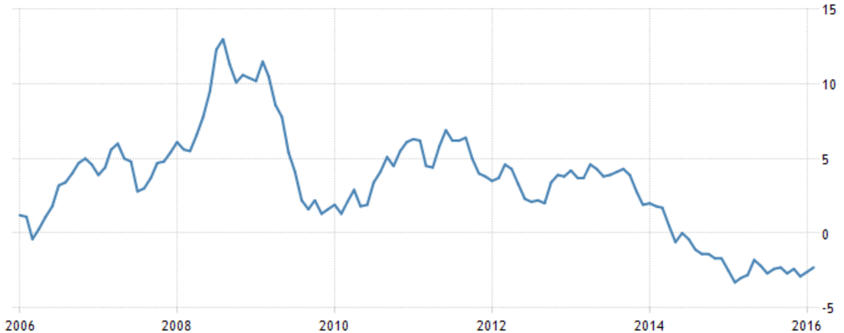
UK FOOD INFLATION